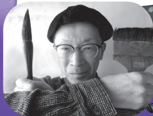
作・出演/ 晴琉屋フン

床に敷いた6畳ほどの紙に絵を描いて話が進行するのですよ！？ (約20分+設置に10分)