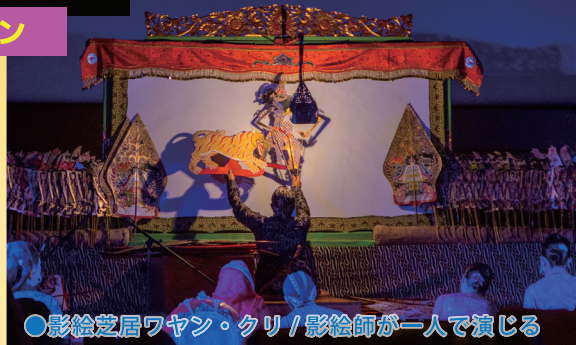
●影絵芝居ワヤン・クリ / 影絵師が一人で演じる

形さばきも見れるように、観客が両面を自由に移動できるように設営。上演はほぼ日本語。公演後には人形やガムランにふれてもらえます。劇場鑑賞スタイル以外に、現地の祭りのように野外で屋台併設市民参加のコーナーを設けた長時間公演も可能です。