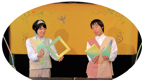
○・△・□～なにしてあそぼ～