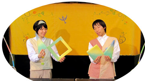
○・△・□～なにしてあそぼ～