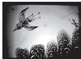
そこで、細かめの線を入れて 出来上がり。