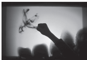
まず砂をばらばらと適当に振り 撒きます。